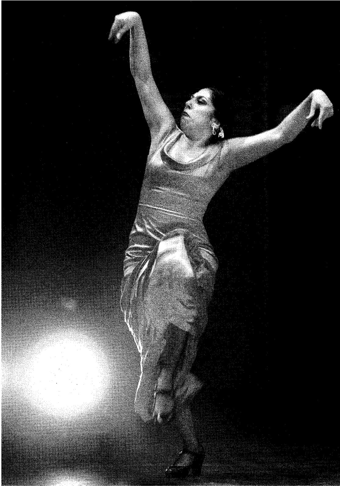
De Spaanse danseres Fuensanta 'La Moneta' bij haar optreden met het Nieuw Ensemble in het Muziekgebouw aan 't IJ. Haar hakken gingen de dialoog aan met klarinet en fluit.